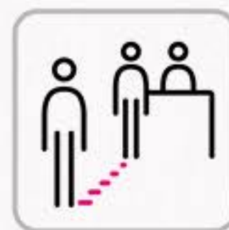
ソーシャルディスタンス確保 Keep social distancing