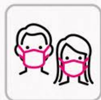
マスク着用 Wearing face masks