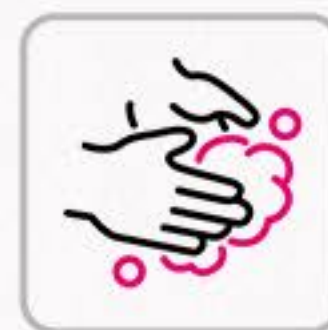
手洗いのご協力をお願いします Please wash hands whenever possible