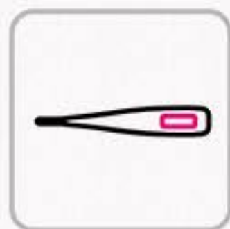
検温の実施 Check body temperature