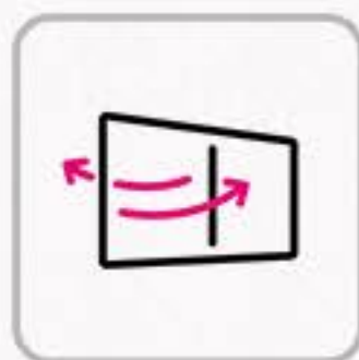
換気の徹底 Thorough ventilation